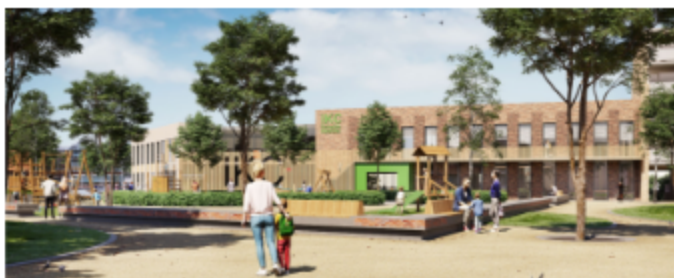
Staan we hier in 2028? (Impressie van nieuwbouw in het Scheidekwartier)

19.15 uur Inloop, 19.30 uur start in het lokaal van groep 6. rond 21 uur ronden we de avond af.