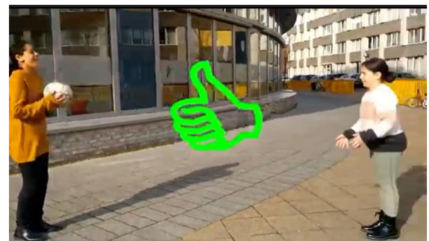
Uit het filmpje van de regel van de maand

"Spullen die van jezelf zijn, daar zorg je goed voor. Wil je iets met de spullen van een ander, dan stel je een vraag."