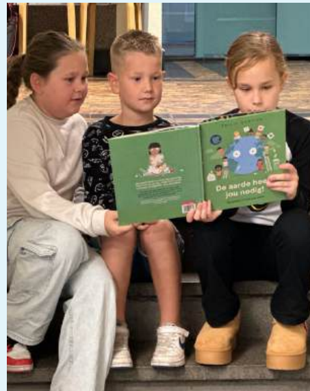
beslissing van de school staat.