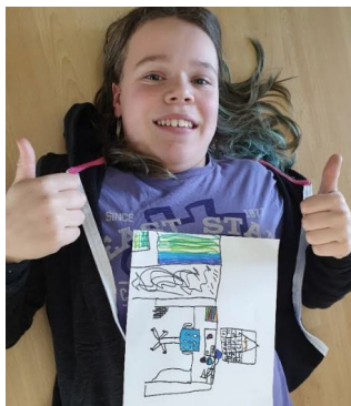
Lieke groep 6

Zodra er duidelijkheid is over het langer dicht zijn van de school krijgt u een aparte brief, waarin staat vermeld hoe het onderwijs verder zal gaan en uitgebreid zal gaan worden met meerdere vakken.